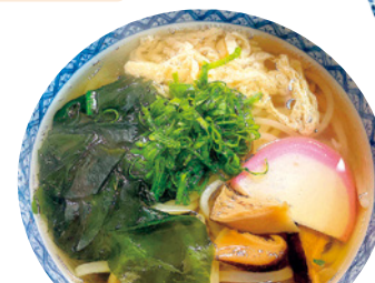
[MAP:A-2] 樽ちゃんうどん・そば