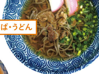
[MAP:B-2] 福縁軒 うどん・そば (備後矢野駅内)