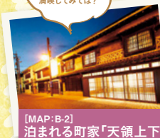
[MAP:B-2] 泊まれる町家「天領上下」